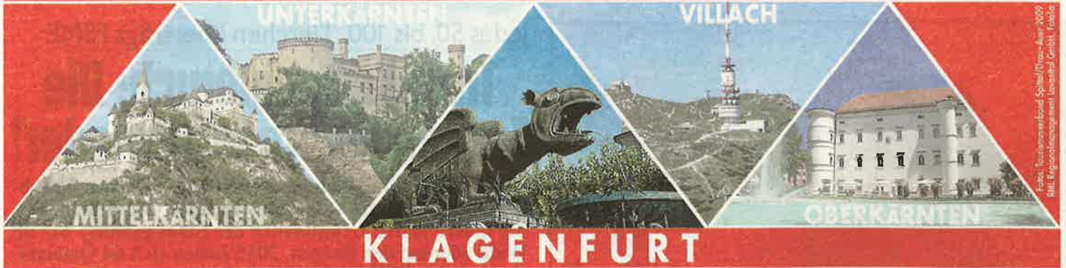
April 2009