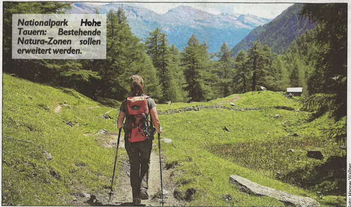
Nationalpark Hohe Tauern: Bestehende Natura-Zonen sollen erweitert werden.

Um die Wogen zu glätten, will Naturschutzreferent Rolf Holub im Einvernehmen mit den jeweiligen Grundeigentümern einen Management-Plan für die Schutzgebiete ausarbeiten und Kompromisse erzielen: „Wir wollen niemanden enteignen!“ Er stellt Entschädigungszahlungen für die Grundbesitzer in Aussicht. Eine entsprechende Gesetzesnovelle ist in Arbeit.